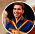
Borguinha de Braga